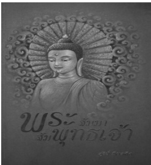
สุริย์ มีผลกิจ, ผู้แต่ง

พระสัมมาสัมพุทธเจ้า เป็นหนังสือที่แต่งขึ้นโดยสุริย์ มีผลกิจ อุบาสิกาผู้มีความศรัทธาในพระพุทธศาสนา ยึดแนวทางแห่งการปฏิบัติตามองค์สมเด็จพระสัมมาสัมพุทธเจ้า ศึกษาเรียนรู้พระไตรปิฎกอย่างถ่องแท้ เพื่อเป็นแนวทางในการดำเนินชีวิต เมื่อได้พิสูจน์ผลแห่งธรรมนั้นแล้ว ก็ตกผลึกผลิตผลงานในพระพุทธศาสนาหลายเรื่อง ได้แก่ พระคัมภีร์อุปปาตะสันติ พระไตรรัตน์ขจัดภัย พระพุทธกิจ ๔๕ พรรษา ตามรอยพระธรรมของพระบรมศาสดาภาพเล่าพุทธประวัติ วันสำคัญในพระพุทธศาสนา คุณธรรม จริยธรรม สามัคคีธรรม พระเวสสันดรชาดก พระคัมภีร์มหาชาติมหาเวสสันดรชาดก ลังสารวัฏ พระพุทธเจ้า ๕ พระองค์ในภัทรกัป ซึ่งผลงานดังกล่าวนี้ เป็นที่ประจักษ์ว่า