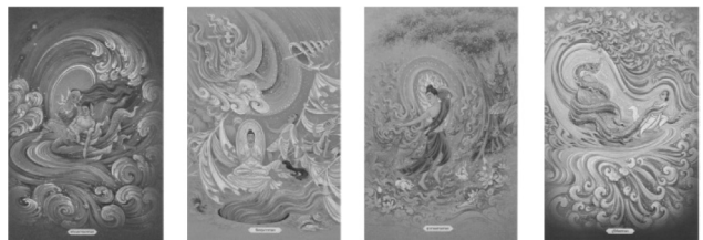
ตัวอย่างภาพประกอบภาพชุดทศชาติ