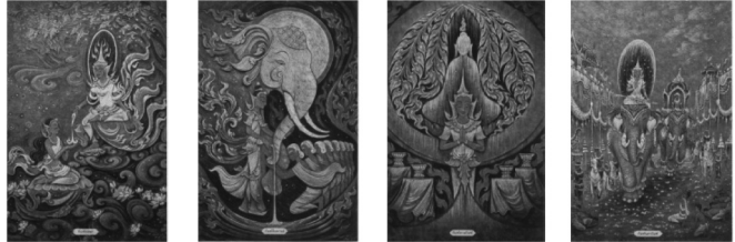
ตัวอย่างภาพประกอบภาพชุดมหาชาติ