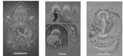
ตัวอย่างภาพประกอบภาพชุดพระโพธิสัตว์บำเพ็ญบารมี